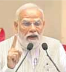
21वीं सदी नारी शक्ति वंदन को समर्पित

एजेसी ► नई दिल्ली प्रधानमंत्री नरेंद्र मोदी विज्ञान भवन में नेशनल लेवल के 'नारी शक्ति वंदन सम्मेलन' में शामिल हुए। इस दौरान पीएम मोदी ने कहा कि हमारे देश की संसद एक नया इतिहास रचने के करीब है। एक ऐसा नया इतिहास, जो अतीत की संकल्पनाओं को साकार करेगा, जो भविष्य के संकल्पों को पूरा करेगा।