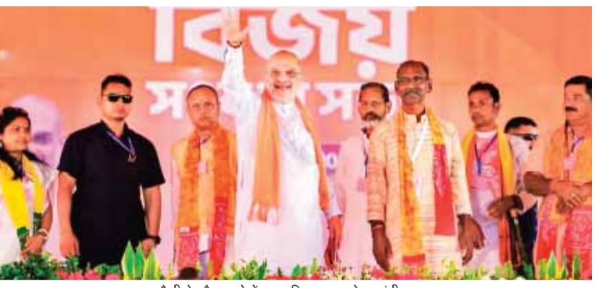
रैली के दौरान लोगों का अभिवादन करते गृहमंत्री शाह

बीरभूम में शाह ने दो और पश्चिम बर्धमान में एक बड़ी चुनावी रैली को संबोधित किया। इस दौरान उन्होंने टीएमसी पर कड़ा प्रहार किया। शाह ने कहा बंगाल में 5 मई को भाजपा की सरकार बनने वाली है। दीदी को टाटा-बाय-बाय कहने का निर्णय जनता ने ले लिया है।