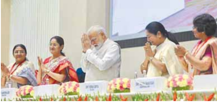
पीएम मोदी 'नारी शक्ति वंदन सम्मेलन' में नारी शक्ति का अभिवादन करते हुए

लोकतांत्रिक संरचना में महिलाओं को आरक्षण देने की जरूरत दशकों से साल 2023 में आया था नारी शक्ति वंदन अधिनियम अब समय आ गया है कि इसे कानून का रूप दिया जाए