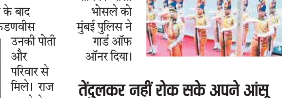
गायिका आशा भोसले को मुंबई पुलिस ने गार्ड ऑफ ऑनर दिया।