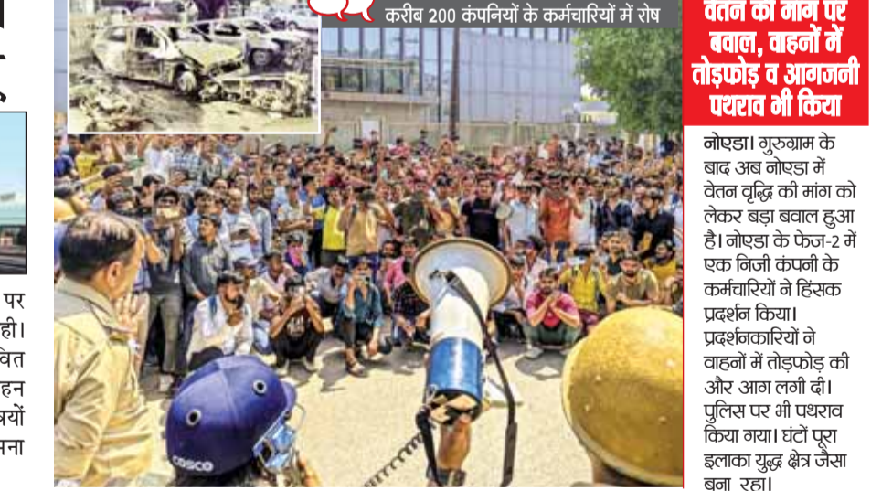
करीब 200 कंपनियों के कर्मचारियों में रोष

नोएडा। गुरुग्राम के बाद अब नोएडा में वैतन वृद्धि की मांग को लेकर बड़ा बवाल हुआ है। नोएडा के फेज-2 में एक निजी कंपनी के कर्मचारियों ने हिंसक प्रदर्शन किया। प्रदर्शनकारियों ने वाहन में तोड़फोड़ की और आग लगी दी। पुलिस पर भी पथराव किया गया। घंटों पूरा इलाका युद्ध क्षेत्र जैसा बना रहा। वैतन की मांग पर बवाल, वाहनों में तोड़फोड़ व आग लगी पथराव भी किया