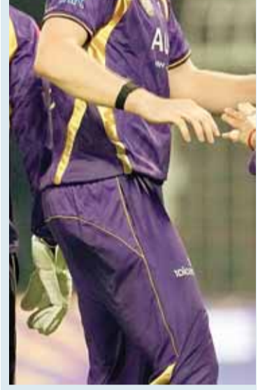
►► चेन्नई

पिछले मैच में जीत से उत्साहित चेन्नई सुपर किंग्स (सीएसके) की टीम मंगलवार को होने वाले इंडियन प्रीमियर लीग के मैच में अब तक एक भी मैच नहीं जीतने वाली कोलकाता नाइट राइडर्स (केकेआर) की टीम के खिलाफ दबदबा बनाने की कोशिश करेगी। सीएसके ने दिल्ली कैपिटल्स के खिलाफ खेल के हर विभाग में अच्छा प्रदर्शन करके सत्र की अपनी पहली जीत दर्ज की। उसकी इस जीत के नायक संजू सैमसन रहे, जिन्होंने 56 गेंद पर नाबाद 115 रन की पारी खेली।