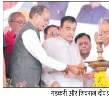
गडकरी और शिवराज दीप प्रज्ज्वलित करते हुए

बीज से बाजार तक की योजना पर अमल के लिए बनेगा टास्क फोर्स