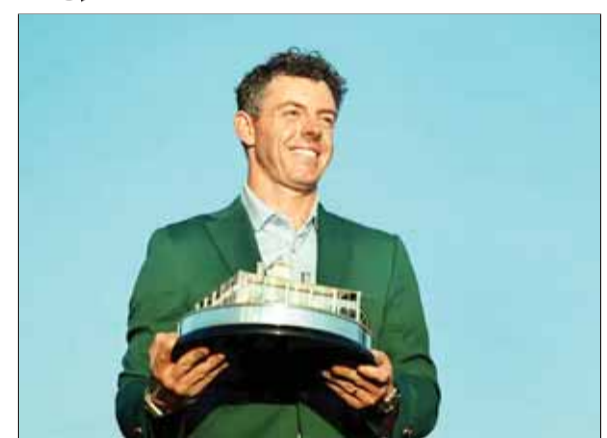
एजेसी ►► ऑगस्टा

रॉरी मैकलॉय मास्टर्स गॉल्फ टूर्नामेंट में अपने खिताब का बचाव करके जैक निकोलस, निक फाल्डो और टाइगर वुड्स के विशिष्ट क्लब में शामिल हो गए हैं। मैकलॉय (67, 65, 73, 71) को इस बीच कुछ विषम परिस्थितियों से गुजरना पड़ा लेकिन आखिर में वह एक शॉट से जीत हासिल करने में सफल रहे। उन्होंने कुल 12 अंडर 276 का स्कोर बनाया और स्कॉटी शेफ़रलर पर एक शॉट से जीत हासिल की। मैकलॉय ने तीसरे राउंड में छह शॉट की बढ़त गंवा दी थी, लेकिन अंतिम राउंड के आखिर में उन्होंने दो शानदार बर्डी लगाकर शीर्ष खिलाड़ियों की सूची में अपना नाम शामिल कर लिया। मैक लॉय इस तरह से वुड्स, फाल्डो और निकोलस के बाद मास्टर्स में अपने खिताब का बचाव करने वाले चौथे गॉल्फर बन गए।